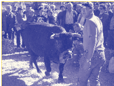
Présentation des meilleurs sujets de bétail en provenance de la région des vals de Bagnes et d'Entremont

matin. L'affluence de spectateurs a démontré que ce type d'animation a pleinement sa place dans une telle manifestation.