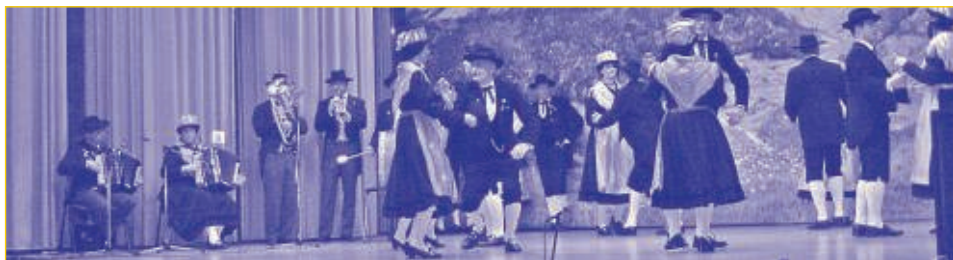
Le groupe folklorique des Bouetsedons d'Orsières a agrémenté la soirée de gala de ses danses typiques.