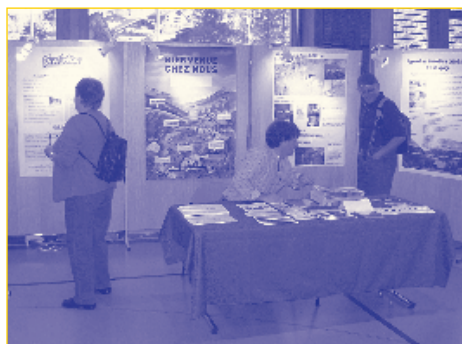
La présence permanente d'un technicien a permis de donner toutes les informations souhaitées.

La projection de films thématiques a eu un franc succès. Trois sujets ont été présentés, illustrant l'élevage caprin, l'utilisation des chiens de protection de troupeaux dans le monde et un documentaire présenté par l'Hôte d'honneur. Les personnes restées à la Maison des Congrès le samedi après midi ont donc pu bénéficier d'une animation fort appréciée avec la projection de ces trois films. Une deuxième session a été répétée le dimanche