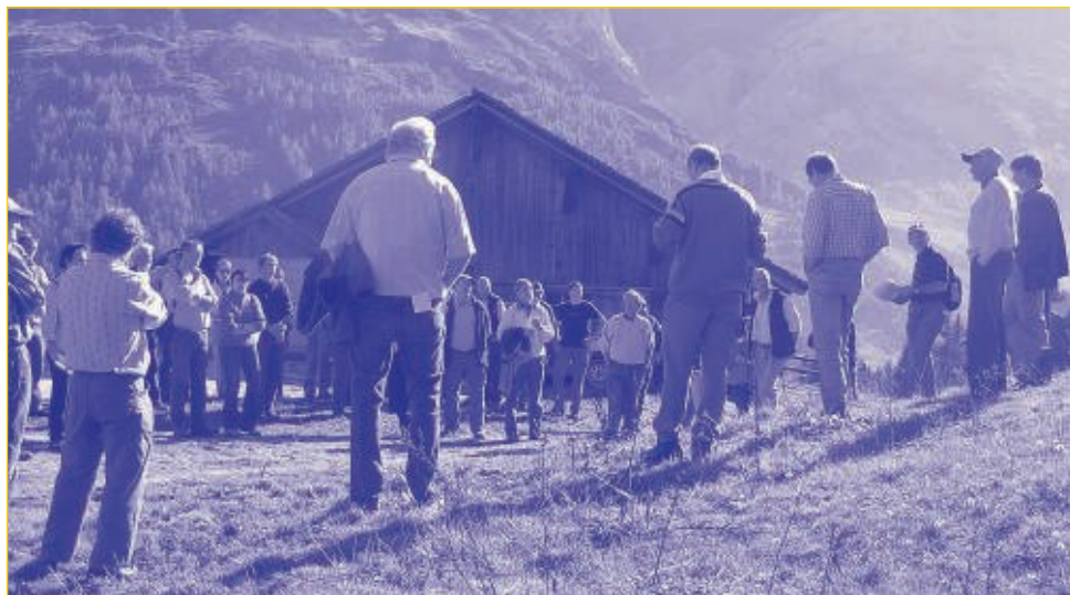
75 personnes ont participé à la visite sur l'alpage du Rard, près du Lac Retaud. La question centrale: y a-t-il un avenir pour la production de fromage pour cet alpage ?

légal afin d'accompagner et non freiner les divers projets émergents.