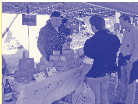
La région « Verbier - St-Bernard », hôte d'honneur du salon, a fait étalage de ses produits au stand de la Corbeille d'Entremont.