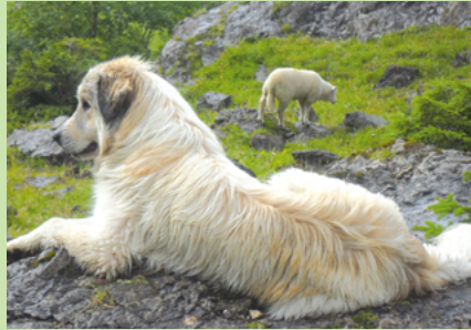
Montagne des Pyrénées