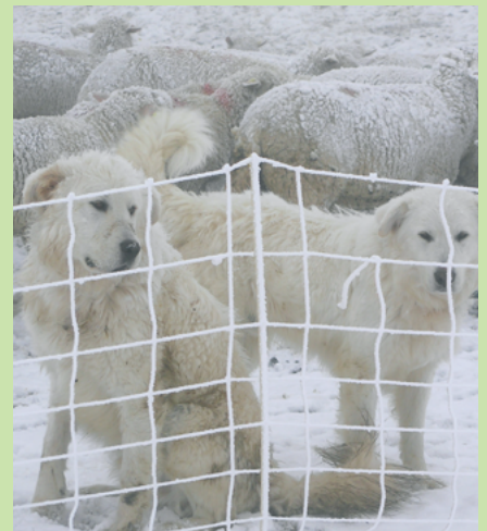
Les CPT sont toute l'année avec leur troupeau, de jour comme de nuit, par beau ou par mauvais temps, et été comme hiver. Les chiens et le troupeau doivent être contrôlés régulièrement.