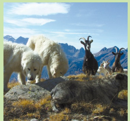
En Suisse, les CPT sont avant tout utilisés pour protéger des moutons, mais ils gardent aussi des chèvres et parfois des bovins.

Si un détenteur d'animaux de rente veut acquérir un CPT pour protéger son troupeau, il doit d'abord formuler une demande auprès du préposé à la protection des troupeaux de son canton. Si l'utilisation de CPT est possible et s'avère être la meilleure solution, il doit obligatoirement suivre un cours théorique (attestation de compétences pour détenteur de CPT) puis un cours pratique avec ses CPT. Avant la montée à l'alpage, il doit évaluer les risques d'incidents avec les touristes et mettre en place des mesures pour les minimiser. Un guide créé par le service de prévention des accidents dans l'agriculture (SPAA) a été élaboré afin d'aider les exploitants à satisfaire à leur devoir de diligence lors de l'utilisation de CPT.