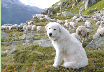
Maremma des Abruzzes