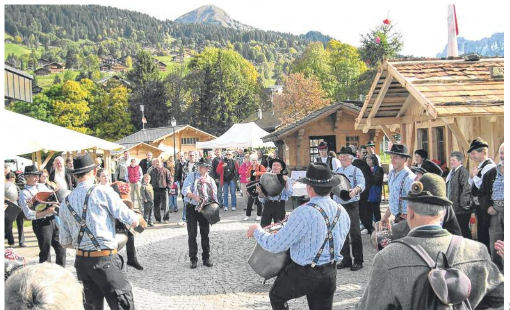
Animation folklorique dans l'enceinte de la Maison des congrès.