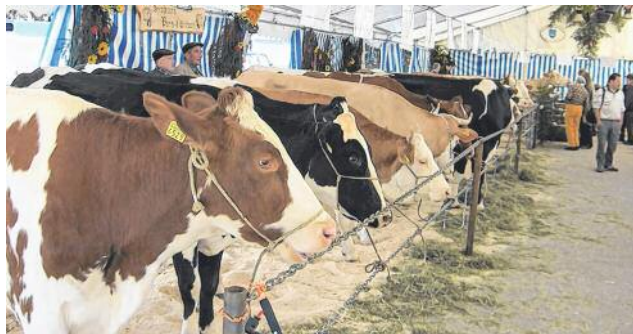
Comme en 2011, il y aura une exposition de bétail.