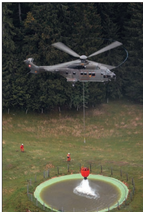
Ravitaillement d'un étang par hélicoptère.