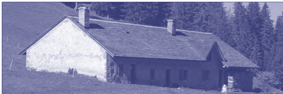
Le chalet du Creux-du-Croue, commune d'Arzier.