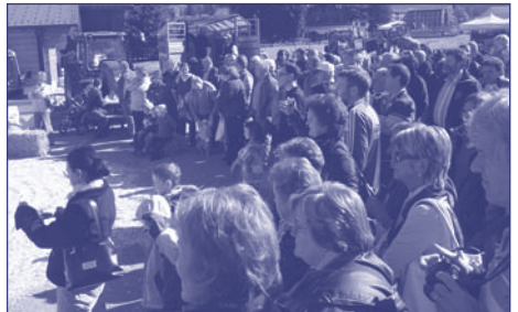
Durant les deux jours, près de 3'000 personnes ont visité la manifestation: ici la présentation du bétail, un moment toujours fort apprécié.

su apprécier cette plate-forme de rencontres et d'échanges à destination aussi bien des acteurs de l'économie alpestre et forestière, que du grand public.