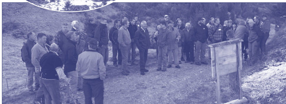
La problématique de l'entretien des alpages et de l'avancement de la forêt a été démontré et a pu être discuté dans le terrain lors de l'excursion sur l'alpage du Pillon.