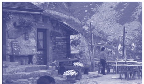
Les offres touristiques comme la restauration ou l'hébergement, doivent rester limitées en termes de places assises et de lits.

L'OAT ne contient aucune disposition exécutoire au sujet de cette problématique. Dans les explications de l'Office fédéral du développement territorial connues à ce jour se trouvent cependant quelques précisions. Plus particulièrement, l'activité accessoire dans un centre d'exploitation temporaire n'est admissible que pen-