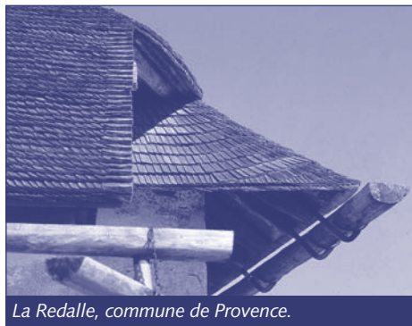
La Redalle, commune de Provence.

priétaire du fonds, a été entreprise en 2011. Le coût des travaux a été pris en charge par l'Établissement cantonal d'assurance contre l'incendie et les éléments naturels.