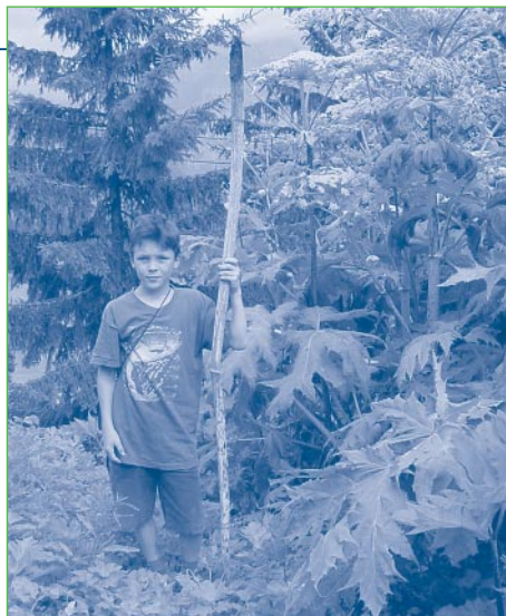
La berce du Caucase ( Heracleum mantegazzianum ) peut atteindre 2 à 4 m de hauteur.

Cette espèce a un grand potentiel de diffusion et se trouve maintenant dans tout l'est du canton de la plaine jusqu'à 2'000 m, dans la région lausannoise et de manière actuellement sporadique dans le Jura. Elle peut devenir une plante très envahissante dans les prairies et pâturages.