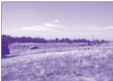
Pâturage de la Petite-Ronde, Les Verrières (NE).

conditions pédo-climatiques de La Petite Ronde, une diminution du cheptel bovin ne rime pas forcément avec développement de buissons. La composition botanique des parcs est restée très stable, indépendamment du niveau de chargement. Avec une faible charge en bétail, il est impératif d'augmenter le nombre de parcs (idéalement 6 à 9) et d'avancer fortement la date du début de la pâture.