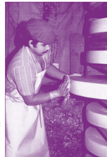
Fabrication de fromage à l'alpage; faut-il sortir du contingentement ou non ?

grande incertitude sur la validité de ces clau-