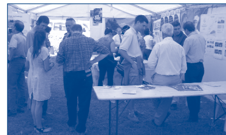
Lors de la présentation de différents posters, les participants ont pu se renseigner entre autres sur des essais de pâture ou l'élaboration d'un atlas des Gruyères d'alpage vaudois.

Dès le début de l'après-midi, les stands de formation et de présentation/vente de produits se sont ouverts. Placés dans deux petites cantines, dans un cadre très jurassien, aux abords du chalet, ils ont permis à un nombre estimé entre 120 et 150 personnes de profiter des informations apportées. Le stand de taxation de fromage, préparé par l'interprofession du Gruyère, a permis aux visiteurs de s'initier aux différents qualificatifs qui caractérisent le goût, l'arôme, la texture et l'apparence du produit lors de l'appréciation.