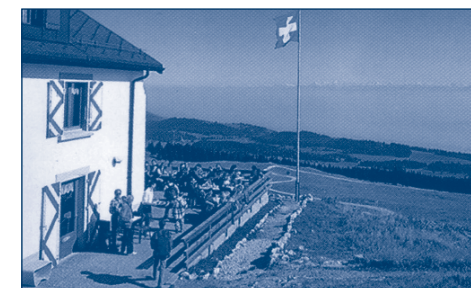
La buvette du Suchet.

blissements avec restauration, elle permet également le service des mets définis par le règlement d'exécution. Ne peuvent obtenir une telle licence que les établissements déployant une activité d'estivage et qui ne sont pas exploités plus de six mois par année.