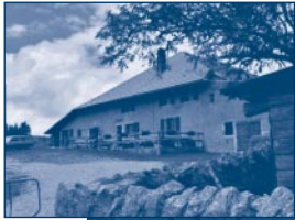
A gauche, la buvette des Cermies et en bas, celle de Thiolle.