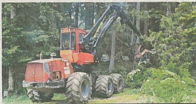
Un processeur forestier sophistiqué pour l'entretien des pâturages boisés.

ser et leur fils Frédy. Environ 70 hectares en tout sur le territoire de la commune du Lieu, dont 35 ha pâturables à Combe Noire. Environ 50 vaches laitières, fabrication de Gruyère d'alpage pour un contingent de 9745 kilos et de raclette. L'amenée de l'électricité et celle d'eau du réseau sont prévues en 2015 pour ce chalet situé à 1120 m. Le local de fabrication est équipé d'une cuve de 1200 l chauffée au feu de bois et d'une presse pour 4 fromages.