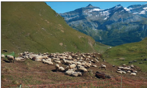
Les clôtures électriques ont fait leurs preuves contre les grands prédateurs.

La directive de l'OFEV sur la protection des troupeaux et des ruches formule des propositions concernant l'organisation cantonale en la matière et règle le soutien financier des mesures de protection. L'ordonnance fédérale sur la chasse (OChP art. 10) et l'ordonnance sur les paiements directs (OPD art. 47 et annexe 7) en constituent le fondement.