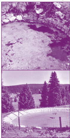
Puits et étang plastifié.

Les résultats d'analyses microbiologiques et chimiques de quatre échantillons successifs (un avant la montée le